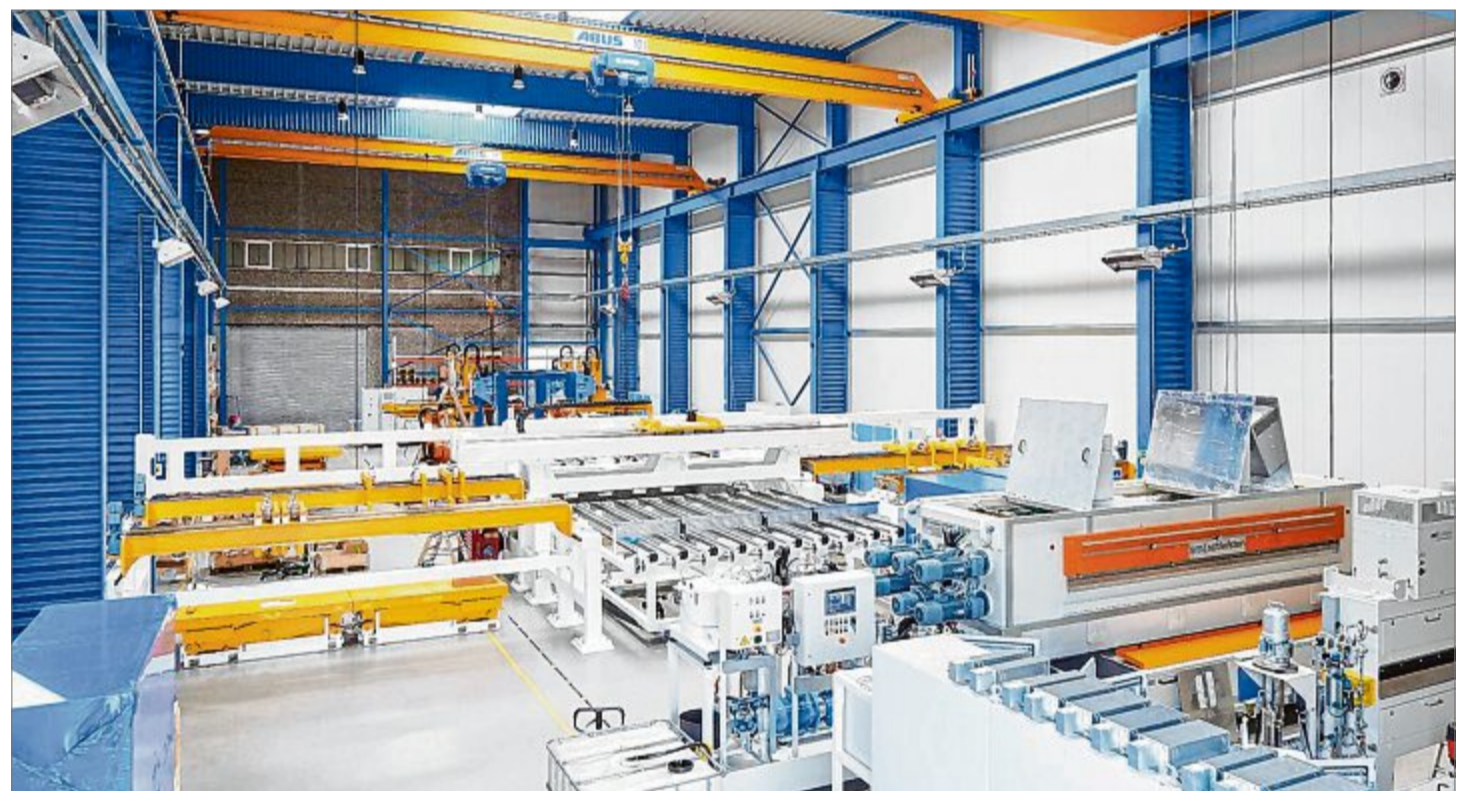
Das Unternehmen bekennt sich zum Standort Weidenau: An der Einheitsstraße wurde eine weitere, etwa 2000 Quadratmeter große Montagehalle errichtet. Im kommenden Jahr soll zudem ein vierstöckiger Anbau an das bestehende Bürogebäude fertiggestellt werden.